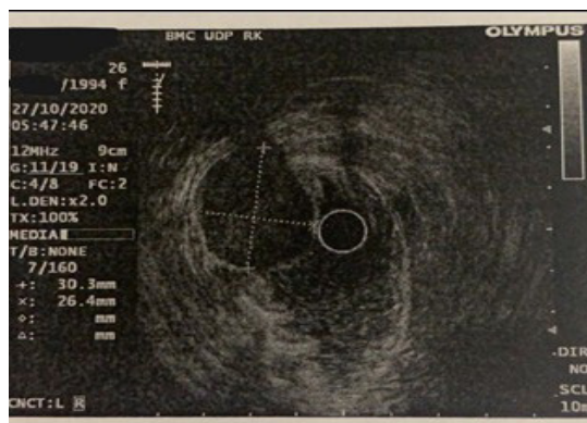
Рисунок 2 - Эндосонографическая картина новообразования

Пациенту была проведена лапароскопическая плоскостная резекция желудка.